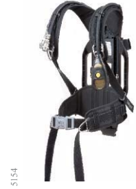
Dräger PSS 5000

Mevcut Dräger PSS Pnömatik ve silindir bant tasarımı ile yaratılan Dräger PSS 5000, teknolojiyi, güncel materyaller ile birleştiren, gelişmiş solunum cihazıdır.