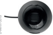
Kamera Interlock® 7000