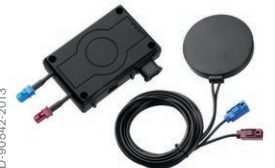
GPRS modülü Interlock® 7000