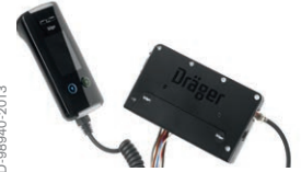
El ünitesi ve kontrol ünitesi Interlock® 7000