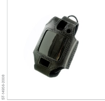
Deri taşıma çantası