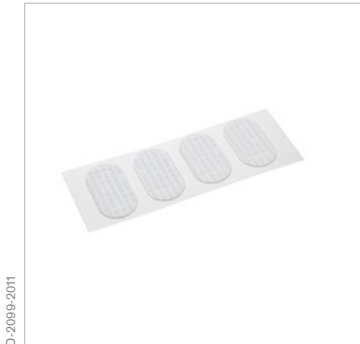
Su ve Toz Filtresi